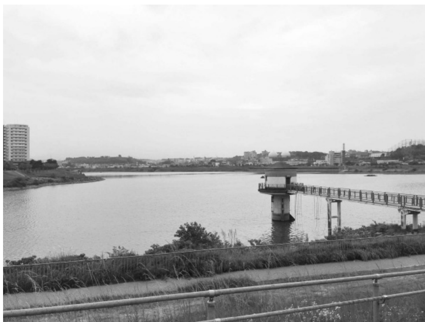
狭山池（北堤から臨む）